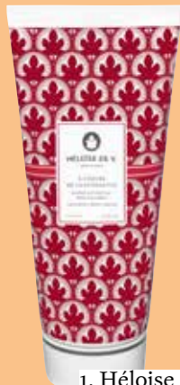
1. Héloïse de V.