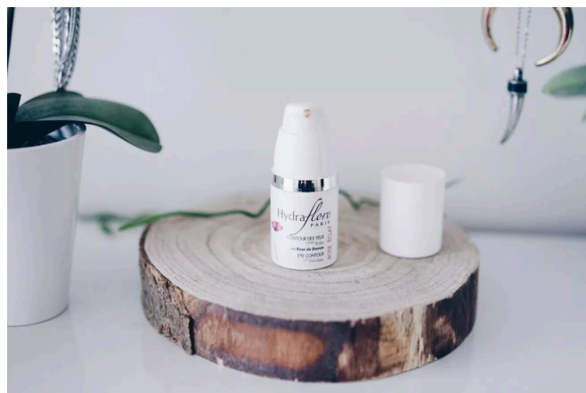
Contour des yeux Rose Eclat Bio

Passons au détail du test des 2 produits.