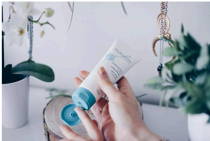
Gommage Doux Clair Lotus

Mon avis : Ainsi, il s'agit ici d'un produit Bio labellisé cosmebio et ecocert. Il a une note de 15,2/20 (pour la compo) sur l'application INCI avec aucun ingrédient controversé. Le flacon pompe est très pratique et hygiénique. Côté texture, on est plus sur un gel type aloe vera. D'ailleurs, on retrouve le même effet tenseur que l'aloë vera. Le parfum est léger et très agréable. Je l'applique le matin, il pénètre rapidement dans la peau et j'avoue que tout de suite il y a un effet lissant. Par contre, je trouve qu'il a tendance à déshydrater cette zone donc il ne doit pas être adapté à ma peau.